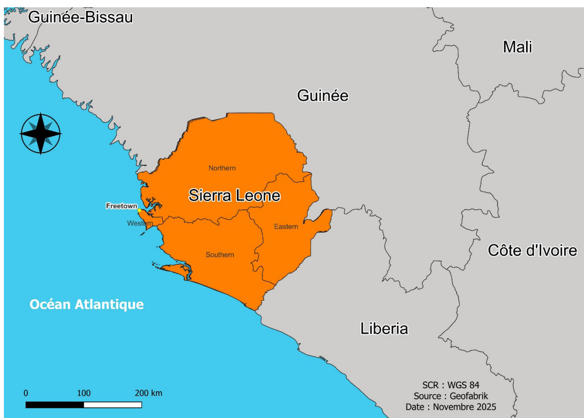
Carte n°1 : La Sierra Leone, réalisée par Moustapha Ngom